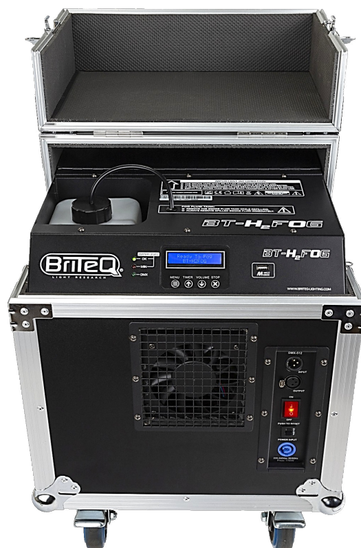
BRITEQ BT-H2FOG Code 802560